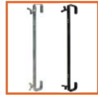
600mm, SWL 50kg