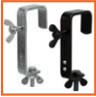
50mm, SWL 50kg