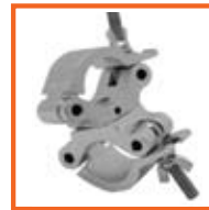
RD48-51mm, 50mm SWL 500kg