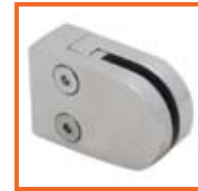
6-10mm plaat/plate TTADHAH90 10-16mm plaat/plate