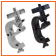
51mm alu. SWL 250kg, M10