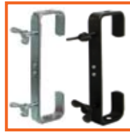
225 mm, SWL 50kg