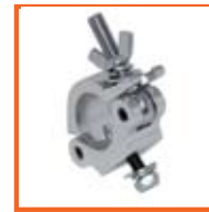
RD48-51mm, 30mm SWL 250kg, M10