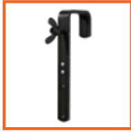
50mm, SWL 50kg