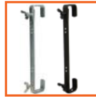
400 mm, SWL 50kg