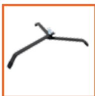
Staal 25 x 8mm M10 bout