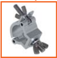
RD32-35mm, 30 mm SWL 75kg, M10