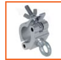
RD48-51mm, 50mm SWL 170kg, met hijssoog/with lifting eye