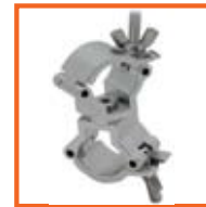
RD32-35mm, 30mm SWL 75kg