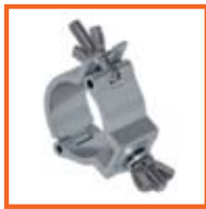
RD48-51mm, 30mm SWL 100kg, M10 slank/thin