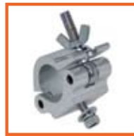
RD48-51mm, 50mm SWL 500kg, M10